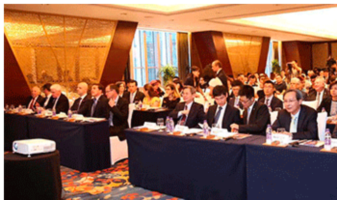
Autoridades nacionales en Expo Beijing

El lunes 19, tuvo lugar el primer seminario de negocios en Beijing, con la participación del vicecanciller chino Zheng Zeguang, medios de prensa y líderes de opinión. La actividad ofreció, además, un acercamiento a lo más destacado de la gastronomía y cultura uruguayas.