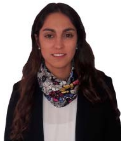
Por la lic. Verónica Rodríguez

En varias oportunidades hemos analizado en este espacio los beneficios fiscales que obtienen las empresas que presenten Proyectos de Inversión ante la Comisión de Aplicación de la Ley de Inversiones (COMAP), al amparo del Decreto N° 2 de 2012 .