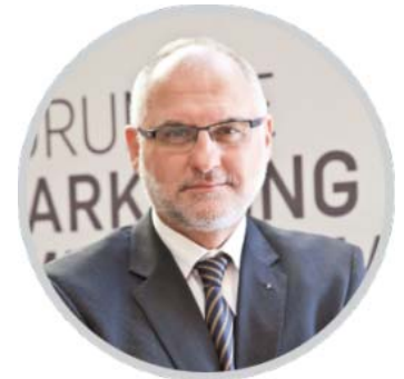
Por Guillermo Sicardi

Los verdaderos países de primera no hacen otra cosa que crear las condiciones económicas, fiscales, jurídicas y laborales para que las UPM y los Juan Pérez puedan invertir sin ser saqueados y sin tener que pedir favores al gobernante de turno. Parten de la base de que si usted fue lo suficientemente inteligente, voluntarioso e innovador para saber ga-