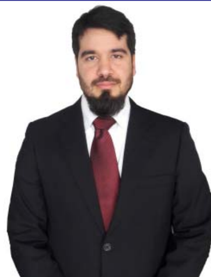
Por el Cr. Eduardo Gutiérrez

Publicado en El Observador el día 27 de abril de 2018.