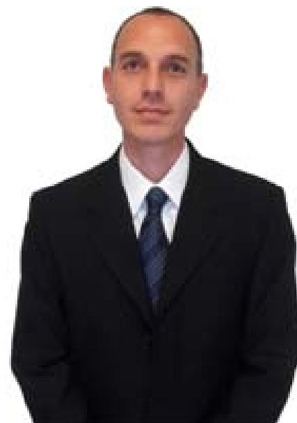
Por: Cr. Nicolás Mega