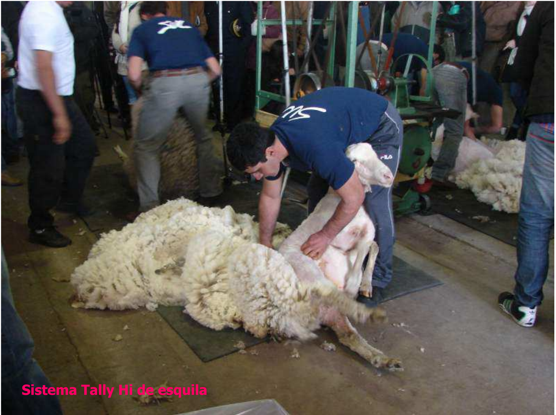
Sistema Tally Hi de esquila