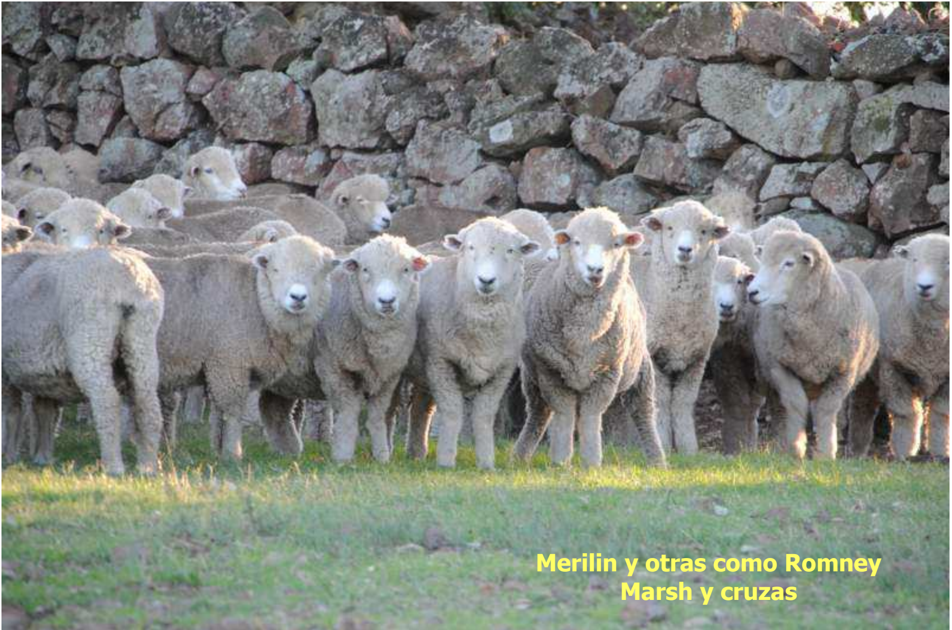
Merilin y otras como Romney Marsh y cruza